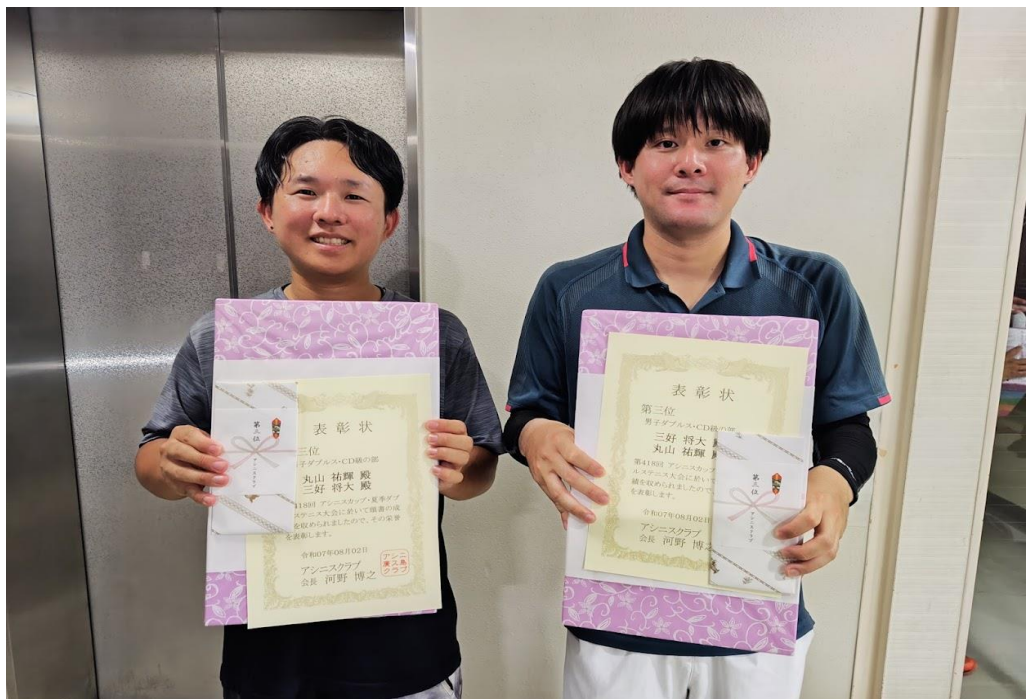
第三位 廣川・榊田 ペア