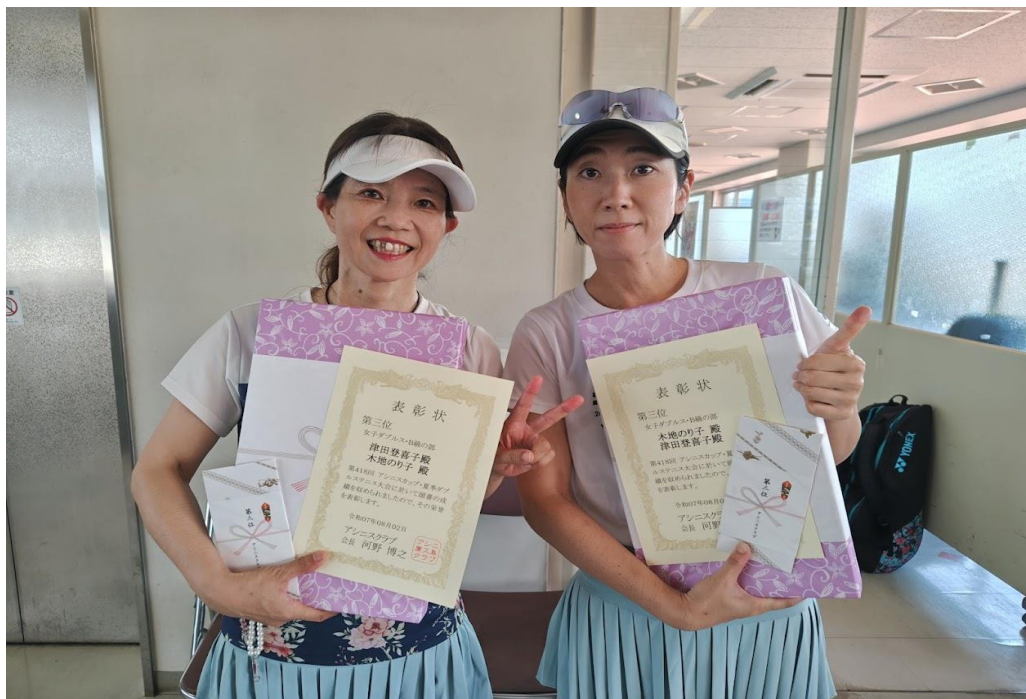
第三位 木地・津田 ペア