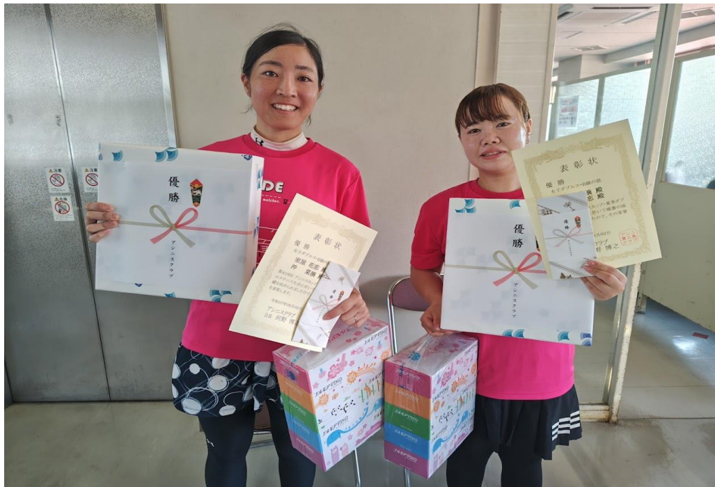
優勝 沖・室屋 ペア