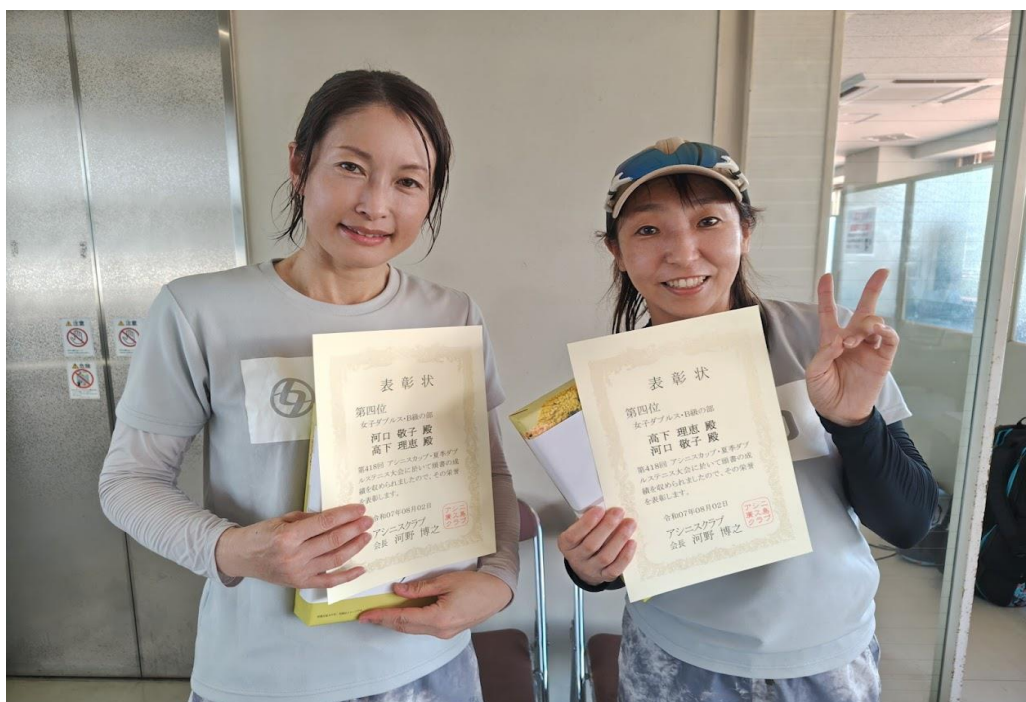
第四位 河口・高下 ペア