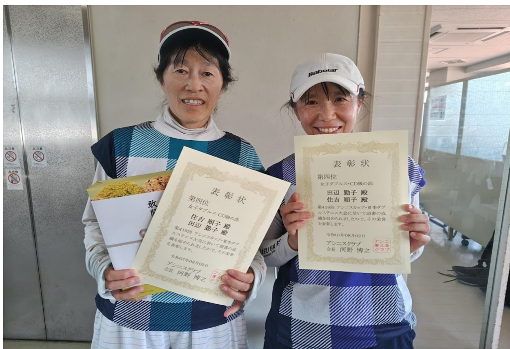
第四位 住吉・田辺 ペア